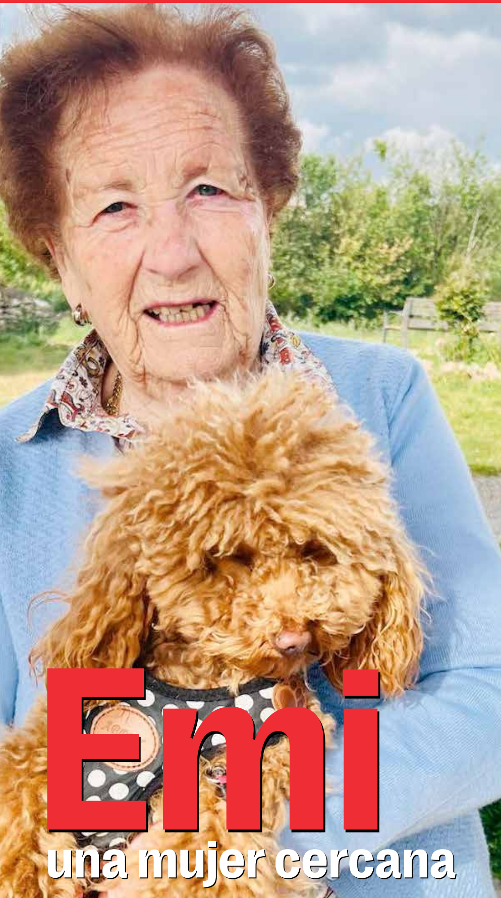
Emi una mujer cercana